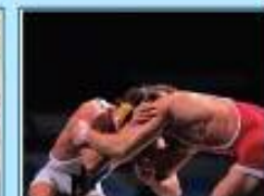
خوه لیکدانی؛ پیرپوچکانی