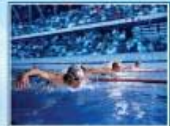
مه له قانیگرن