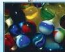
ته به لانی