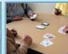
په رگانی؛ پایه زانی