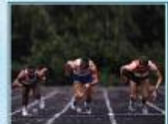
به ره به زینک؛ بازدان