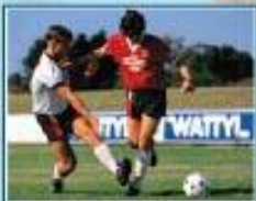
تەپا يىنى؛ ھۇلانى