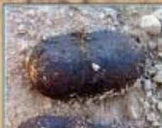
کہرسل : سل