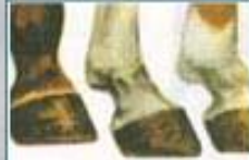
سوم : سم