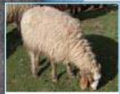
سۈرپە شا كەل