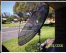
سه ته لایت