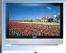
ته له قزيون