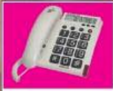
ته له فون