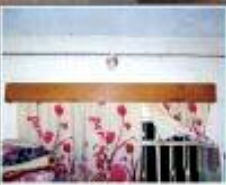
سه رپه نجرک