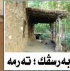
به رسك ! ته رمه