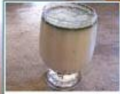
ناشە ماست؛ دەو