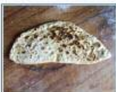
کاده سورک؛ کاده ژازک