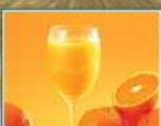
شه ربه ت